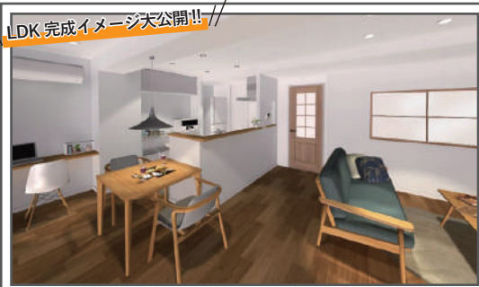
LDK完成イメージ大公開!!

築年数 : 築54年 広さ : 約63㎡ 間取り変更: 2LDK→1LDK+WIC リノベ費用: 約1600万円 キッチン : クリナップ/ステディア お風呂 : LIXIL/リノビオVシリーズ トイレ : TOTO/ネオレストDH1 洗面台 : 造作洗面台 壁 : 全室クロス 床 : 複合フローリング/ 朝日ウッドテック LiveNatural フロアタイル/東リ 玄関タイル/平田タイル 配管交換 : 全交換