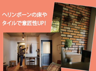
ヘリンボーンの床やタイルで意匠性UP!

施工事例の中からスタッフおすすめの事例をご紹介します。webサイトには他にも多くの事例が掲載されていますので是非、ご覧くださいませ！