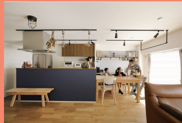
物件種別：マンション（築43年）/ 広さ：78㎡ 家族構成：ご夫婦（30代）+ お子様3人 / 工期60日 / 費用：1100万円 / 中古を買ってリノベ