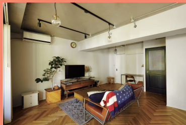
物件種別：マンション（築20年）/ 広さ：88㎡ 家族構成：ご夫婦（40代）/ 工期：50日 / 費用約1100万円 / 中古を買ってリノベ