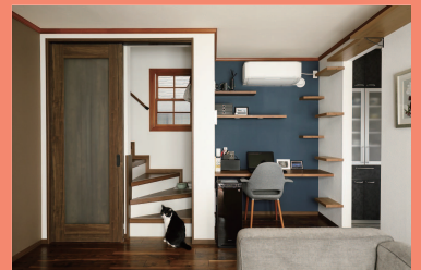
物件種別：戸建て（築16年）/ 広さ：102㎡ 家族構成：ご夫婦（30代）+ 猫2匹 / 工期：80日 / 費用：1300万円 / 中古を買ってリノベ

施工事例の中からスタッフおすすめの事例をご紹介します。webサイトには他にも多くの事例が掲載されていますので是非、ご覧くださいませ！