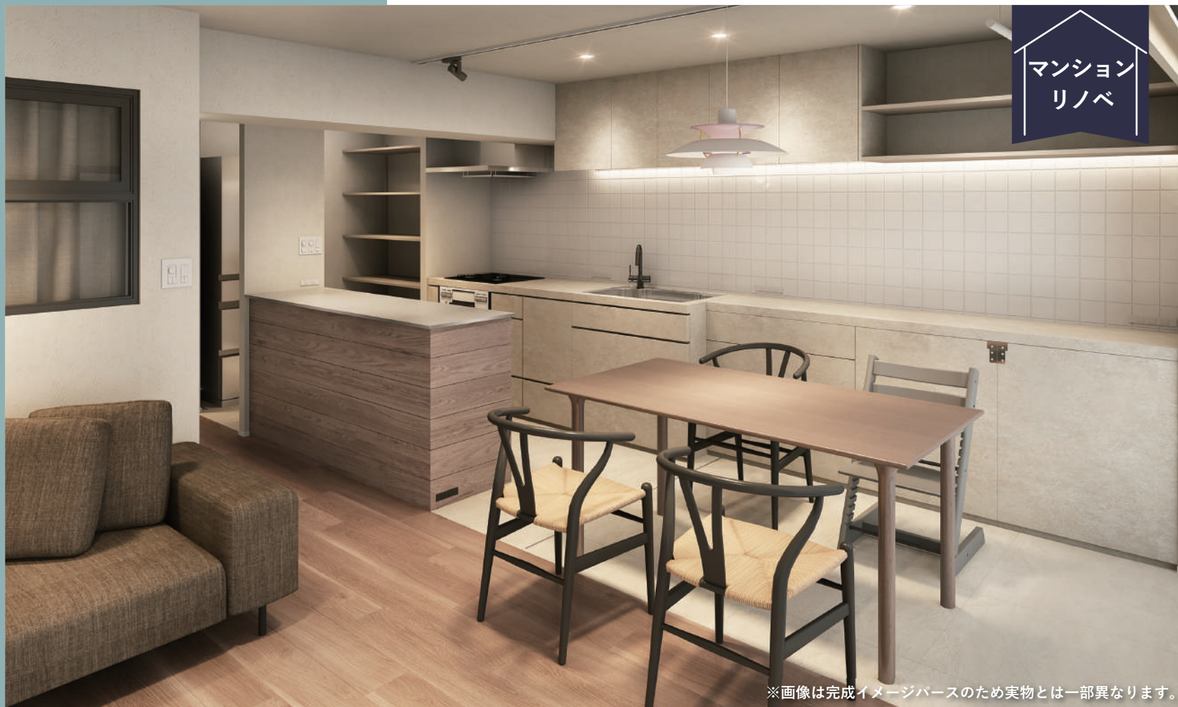
※画像は完成イメージパースのため実物とは一部異なります。