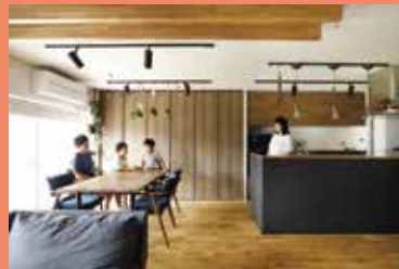
物件種別：マンション(築40年) / 広さ：70㎡ 工期：70日 / 家族構成：ご夫婦(30代)+お子様2人 / リフォーム費用：1028万円 / 中古を買ってリノベ

造作梁や無垢の床、間接照明が醸し出す上質な雰囲気とハンモックの遊び心が調和したリビングダイニングがポイント!!