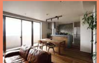
物件種別：マンション(築18年) / 広さ：86㎡ 工期：60日 / 家族構成：ご夫婦(30代)+お子様2人 / リフォーム費用：1150万円 / 中古を買ってリノベ