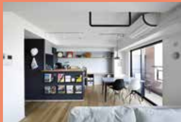
物件種別：マンション / 広さ：70㎡ / 工期：70日 / 家族構成：ご夫婦(30代)+お子様1人 リフォーム費用：890万円 / 持ち家リノベ