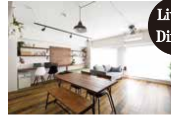
Living & Dining

LDと洋室の窓には二重窓(インプラス)を設置。断熱や結露対策に効果があります！Bluetooth対応の照明を採用し、全てひとつのリモコンで操作できるのも住み心地アップのポイント！