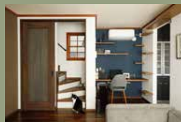
物件種別：戸建て（築16年）/ 広さ：102㎡ 家族構成：ご夫婦（30代）+ 猫2匹 / 工期：80日 / 費用：1300万円 / 中古を買ってリノベ