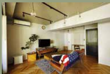
物件種別：マンション（築20年）/ 広さ：88㎡ 家族構成：ご夫婦（40代）/ 工期：50日 / 費用約1100万円 / 中古を買ってリノベ

施工事例の中からスタッフおすすめの事例をご紹介します。webサイトには他にも多くの事例が掲載されていますので是非、ご覧くださいませ！