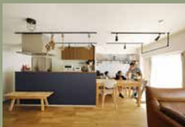
物件種別：マンション（築43年）/ 広さ：78㎡ 家族構成：ご夫婦（30代）+ お子様3人 / 工期60日 / 費用：1100万円 / 中古を買ってリノベ